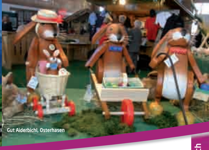
Gut Aiderbichl, Osterhasen