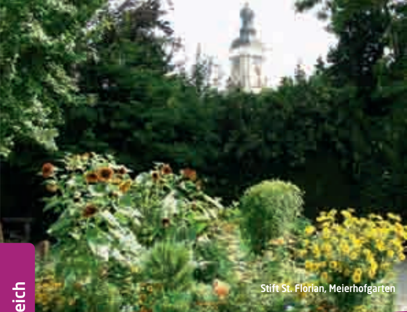
Stift St. Florian, Meierhofgarten