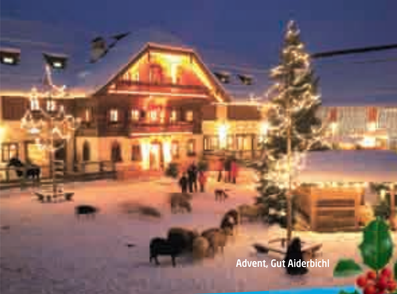
Advent, Gut Aiderbichl