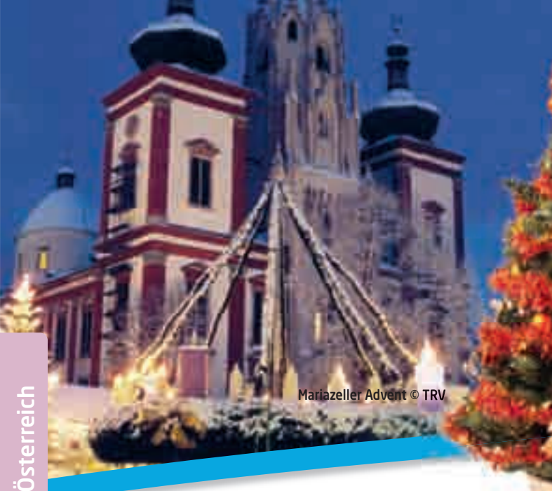
Mariazeller Advent