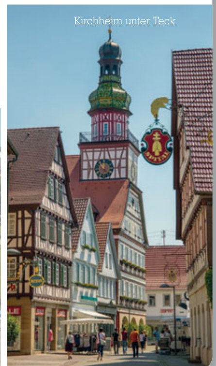
Kirchheim unter Teck