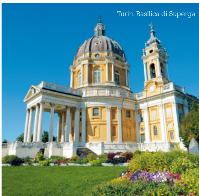
Turin, Basilica di Superga

8 Tage/7 Nächte im DZ € 1.180 Einbettzuschlag € 231 Storno- und Reiseversicherung € 51